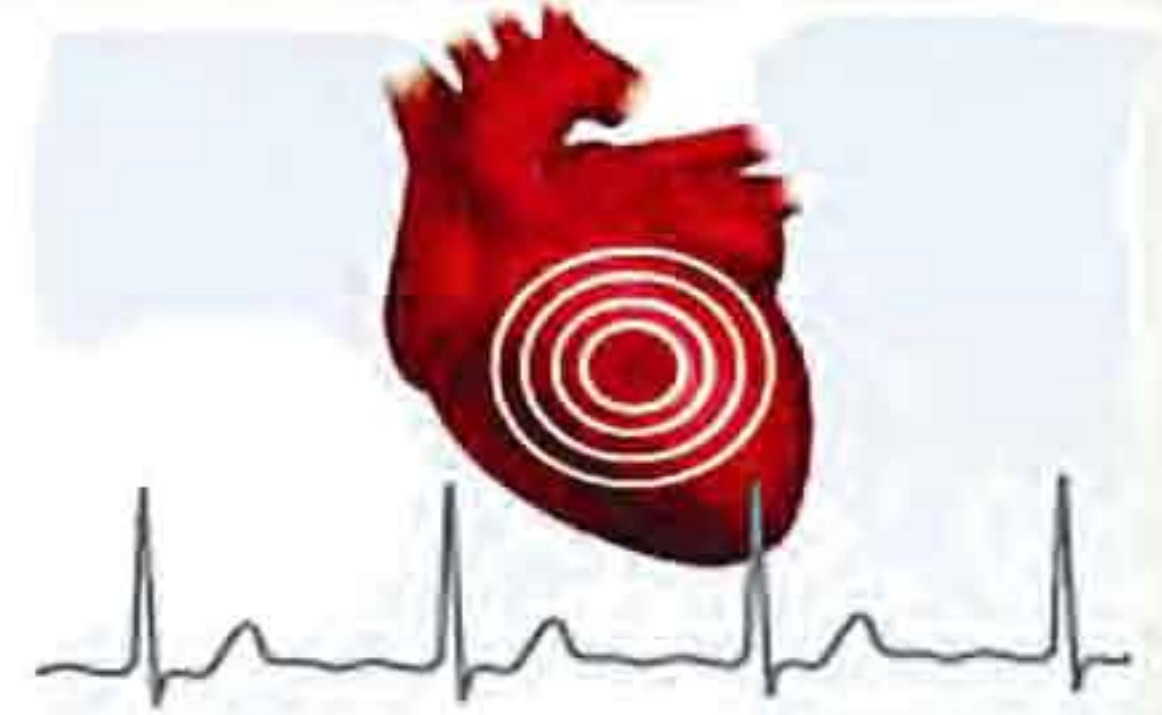
அறுவைச் சிகிச்சை தேவைப்படாத நவீன 'இஎஸ்எம்ஆர்' சிகிச்சை.

இ தய நோயாளிகளுக்கு பயன்படும் வகையில் ESMR எனும் அதிநவீன அறுவை இல்லாத, வலி இல்லாத சிகிச்சை சென்னை அண்ணாநகர் நியோமெட் மருத்துவமனையில் அளிக்கப்படுகிறது.