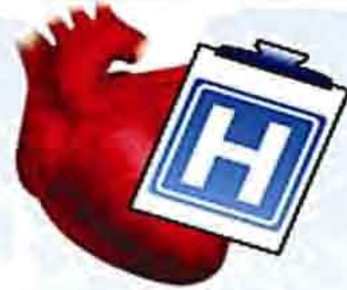
வழக்கமான பை - பாஸ் அறுவைச் சிகிச்சை அல்லது ஆஞ்சியோபிளாஸ்ட்டி சிகிச்சைக்குப் பரிந்துரை.